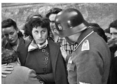
Rome, ville ouverte

Entre 1927 et 1947, il y a eu 20 ans de fascisme et de cinéma mussolinien ennuyeux où les héros ont toujours du sang sur les mains. Le véritable acte de naissance international du néo-réalisme est donné par Rome, ville ouverte (1945), qui décrit avec force l'action de la Résistance. Roberto Rossellini, porte-parole d'une nouvelle esthétique propose le film Paisà (en 1946), plus radical, construit sur le principe de six nouvelles qui construisent une fresque sur les partisans et les alliés. Et ensuite... Le voleur de bicyclette (1947) de De Sica chef d'œuvre du mouvement néo-réaliste mettant en scène un homme partant à la recherche de son vélo volé (pourtant outil indispensable pour pouvoir travailler). Ce film apparaît comme un miroir de la société italienne. Le néo-réalisme italien est là pour décrire une société, les plus grands réalisateurs comme Rossellini, Visconti, Antonioni, De Santis, De Sica et Fellini décrivent ainsi une société.