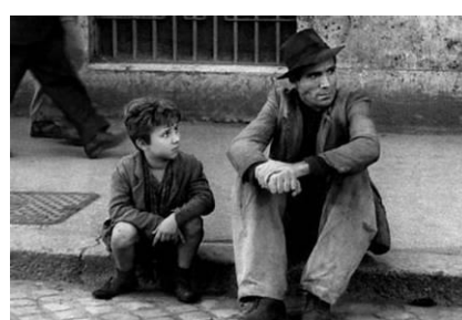
Le Voleur de bicyclette