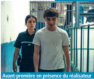
Avant-première en présence du réalisateur