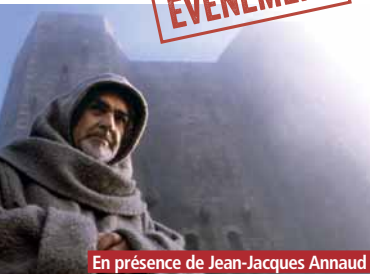
En présence de Jean-Jacques Annaud